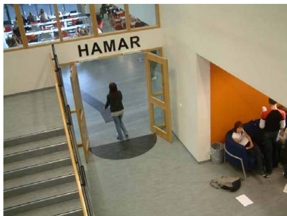
Fleiri eru á vef skólans. Þarna sést óheppileg umgengni!